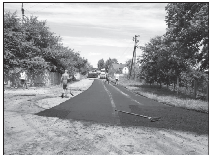
Заасфальтовано дорогу до стадіону «Спартак»