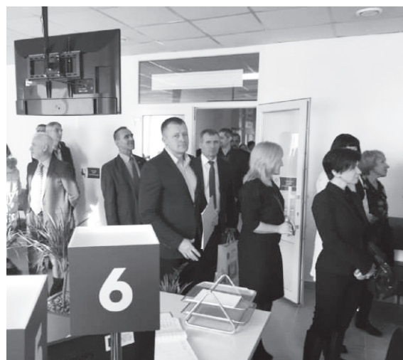
Відкрито оновлений Центр з надання адміністративних послуг