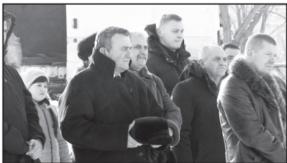
Традиційні Водохресні купання на оновленій зоні відпочинку «Дубенські кар'єри»