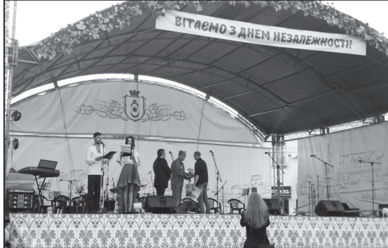
Урочистоті до Дня Незалежності