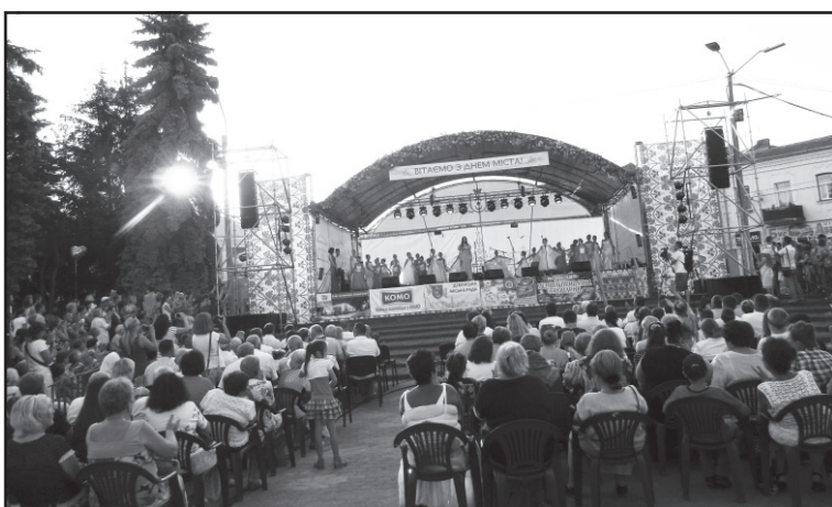
Урочистості до Дня міста