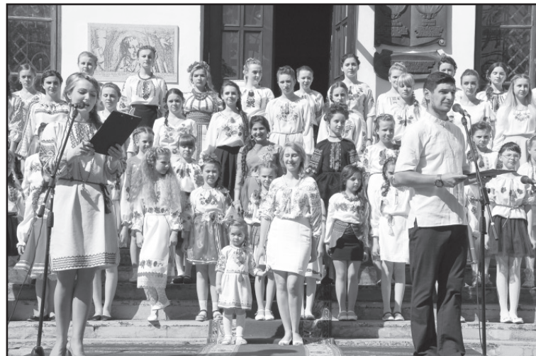
Традицією стало родинне свято, яке проводиться у Дубенському замку