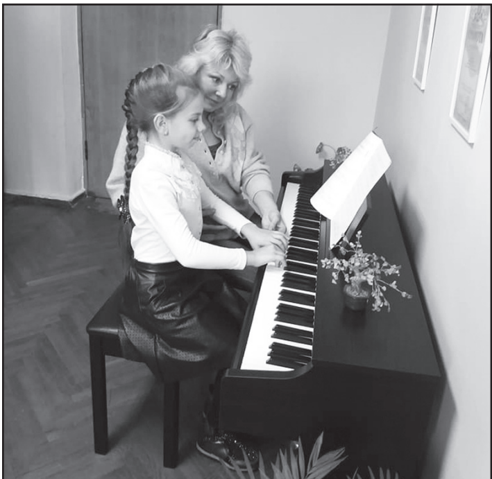
Для школи мистецтв придбано електропіаніно «Yamaha»