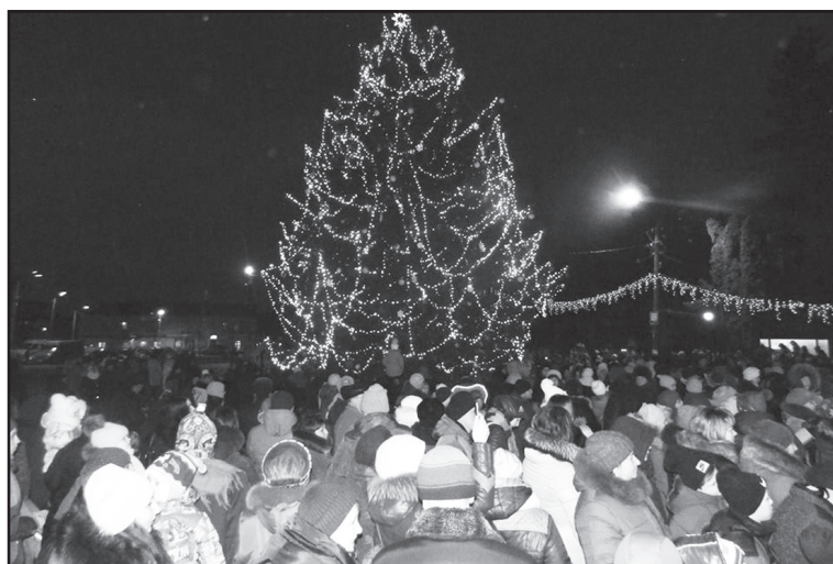
Свято відкриття головної ялинки міста

У 2017 році відбулося 20 засідань виконавчого комітету Дубенської міської ради, на яких було прийнято 566 рішень.