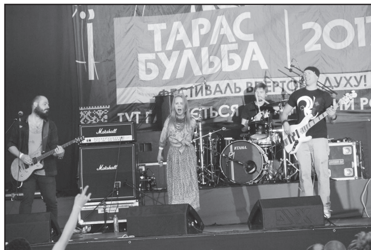
Відроджений рок-фестиваль «Тарас Бульба»