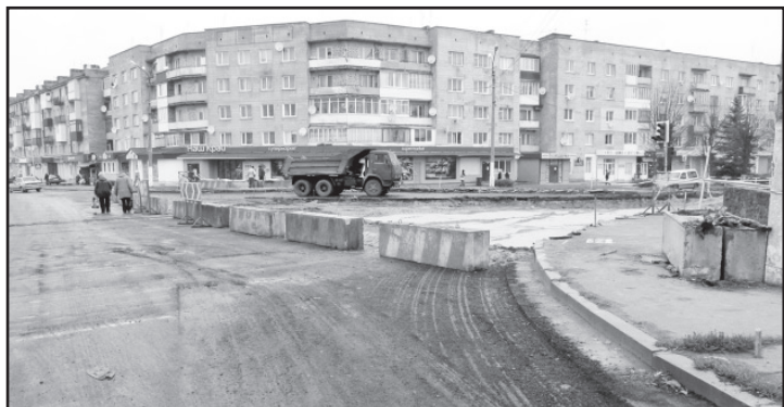
Розпочато облаштування кільцевого руху в мікрорайоні Базарчика