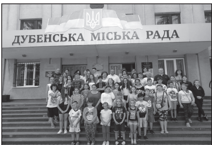
4 Делегація дітей з міста-побратима Гіжицько

Міська влада продовжує співпрацю з міжнародними організаціями та містами-побратимами, відбувався обмін офіційними делегаціями та творчими колективами.