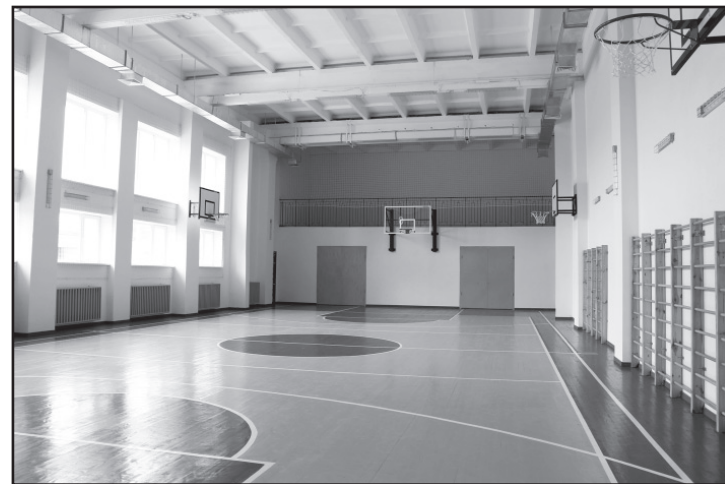
Один із залів спортшколи