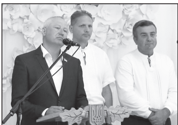
Вдруге у місті проведено регіональний молитовний сніданок