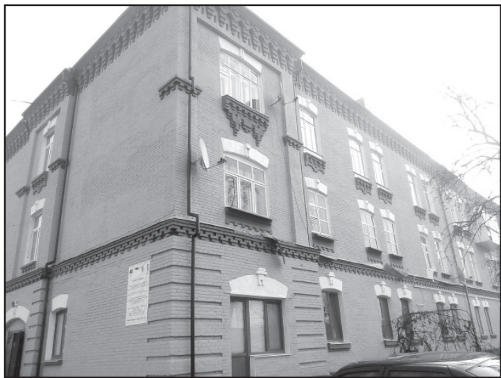
Відремонтовано дах та фасад ОСББ «Авіатор» за програмою ЕС/ПРООН