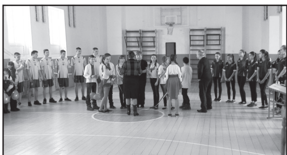
Відкрито оновлену спортивну залу у Дубенській ЗОШ №3