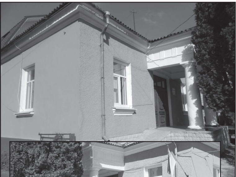
Відремонтоване приміщення станції поліції