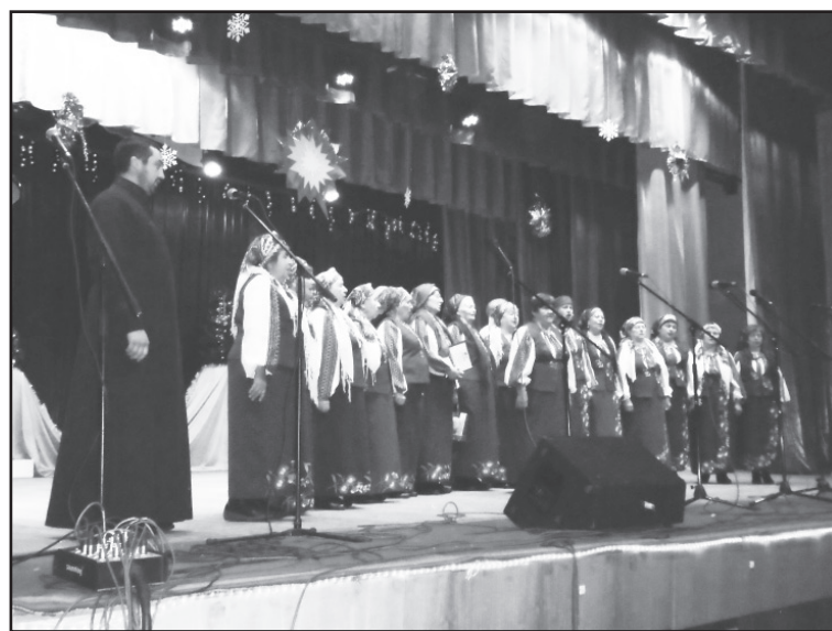
Традиційний фестиваль «Різдвяні піснеспіви»