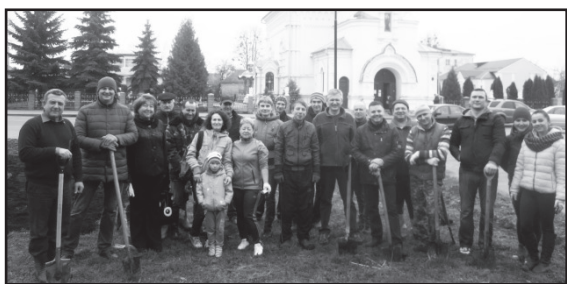
З громадою міста висаджено понад чотириста троянд