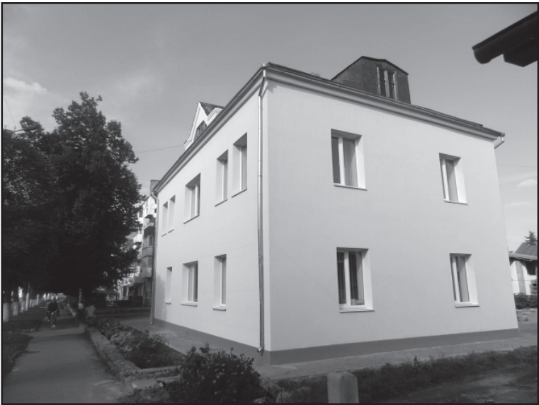
Виконано ремонт фасаду приміщення КП «Архітектор»