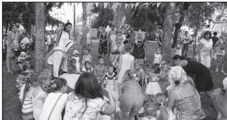
Дитячі розваги на День міста