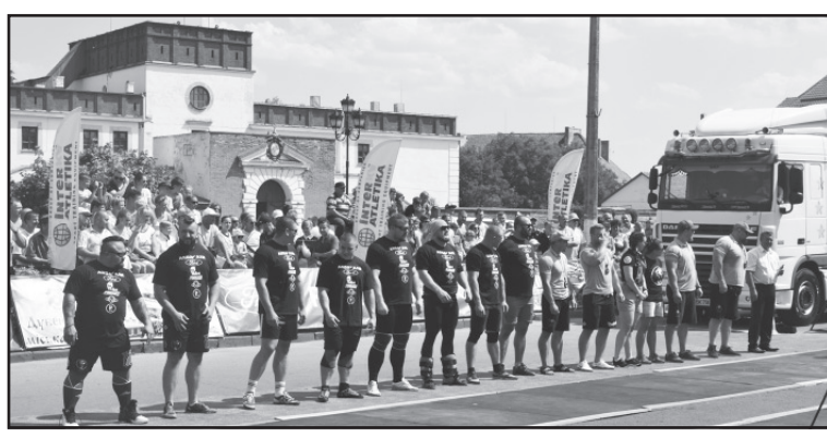
Етап кубку України зі стронгмену відбувся у День міста