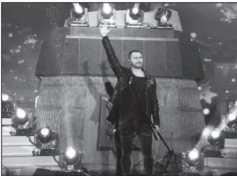
Концерт зіркових виконавців на відкритті пам'ятника