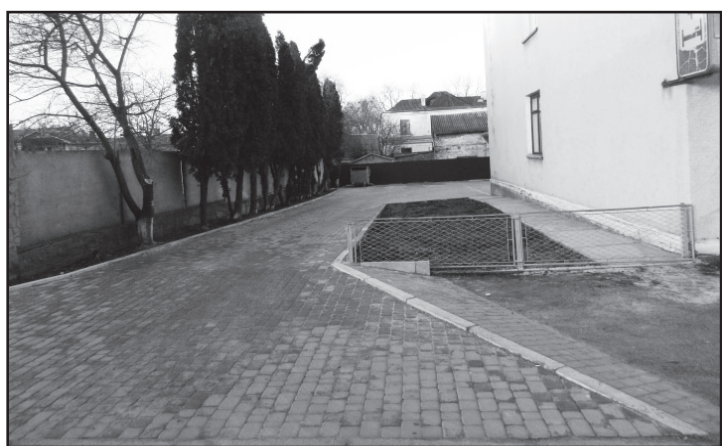
Проведено благоустрій території поруч стоматполіклініки та станції швидкої медичної допомоги

Ж итлове-комунальне господарство відіграє особливу роль у забезпеченні життєдіяльності міської громади. Належне функціонування об'єктів галузі потребує фінансової та матеріальної підтримки. У звітному періоді відбулись зміни в нормативно-правовому забезпеченні діяльності житлово-комунальних підприємств згідно яких, регулювання господарської діяльності, тарифна політика, фінансування програм розвитку галузі, фінансова допомога підприємствам покладена на органи місцевого самоврядування.