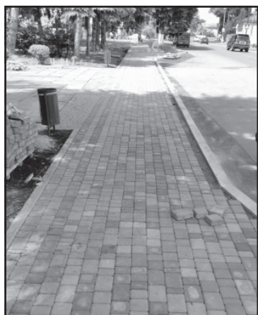
Тротуар на вул.Замковій