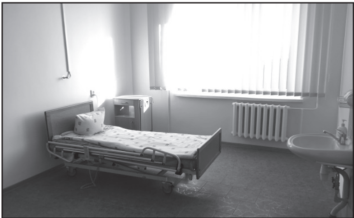
Відкрито нову післяпологову палату