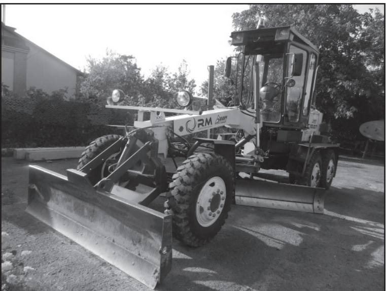
Для комунальників придбано автогрейдер