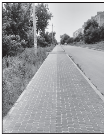
Тротуар з велодоріжкою на вул.Семидубській