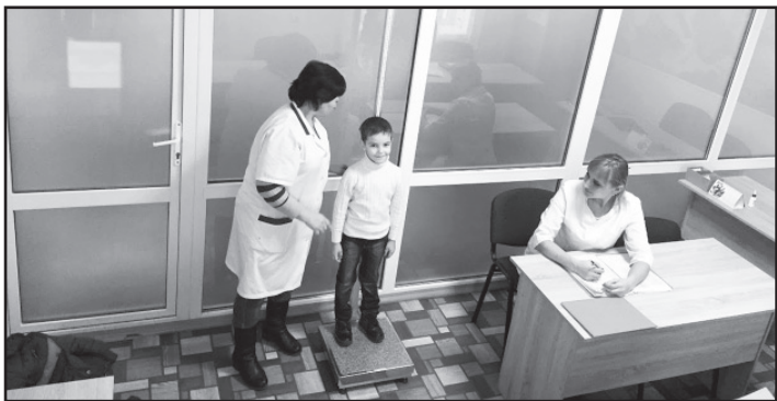
Придбано електронну вагу для новоствореного шкільного кабінету