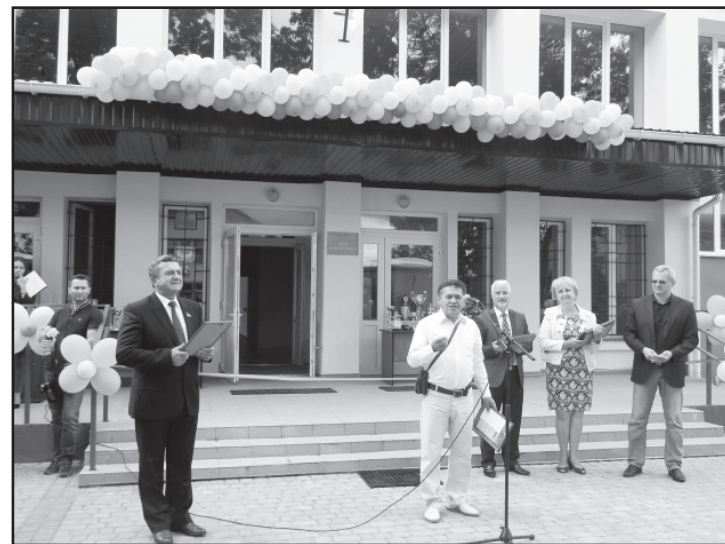
Відкриття спортивної школи

Затвердження проектів детального планування у 2017 році в районі вулиць Грушевського-Семидубської-Пушкіна (територія колишнього військового містечка №1) та районі вулиць Григорія Чубая, Святослава Баля та провулку Берестецького, дало можливість виділити 51 громадянину земельні ділянки (надано дозвіл на виготовлення проектів землеустрою щодо відведення у власність земельних ділянок для будівництва та обслуговування житлових будинків, господарських будівель і споруд (присадибна ділянка)), в тому числі пільговим категоріям: 6 членам сімей загиблих учасників бойових дій, 6 учасникам бойових дій (АТО), які отримали поранення, 1 учаснику бойових дій (АТО) сироті, 4 учасникам бойових дій (воїнам-афганцям, у тому числі одній багатодітній сім'ї) та 37 учасникам бойових дій (АТО) та іншим категоріям, визначеним постійною депутатською комісією з питань архітектури, будівництва, землекористування та земельної реформи.