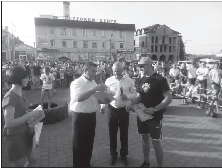
Відзначення кращих представників дубенської молоді, учнів-медалістів та спортсменів