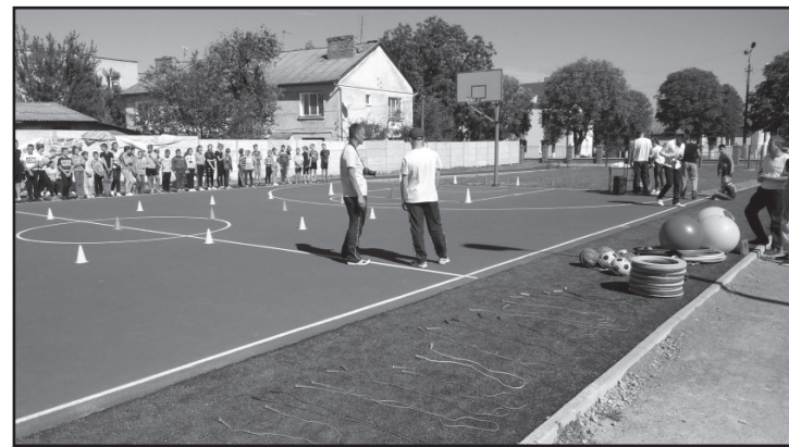
Спортивний майданчик ЗОШ №1