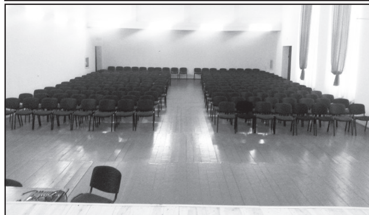
У міському Будинку культури відремонтовано глядацьку залу, оновлено сцену та придбані нові стільці для глядачів