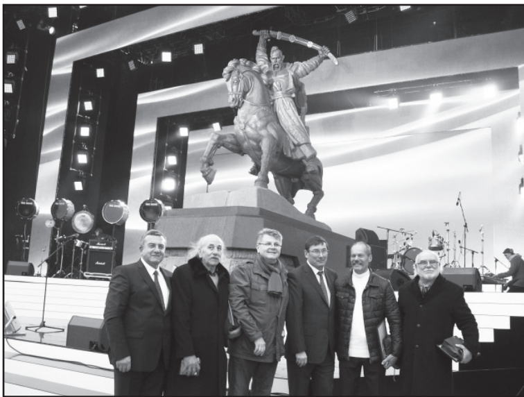
Відкриття пам'ятника Борцям за Волю та Незалежність України