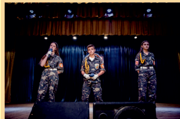
Переможці Ліги гумору Дубна - команда ЗОШ№ 6 «Ні собі, ні людям»