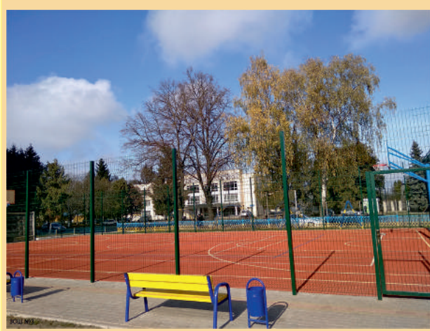
Побудовано спортивний майданчик у 30Ш №3

територій міста в районі вулиць Львівська-Свешнікова-Берестецька, в районі вулиць Грушевського-Семидубської-Пушкіна (територія колишнього військового містечка 1), в районі вулиць Григорія Чубая, Святослава Балея та провулку Берестецького; в районі вулиць Григоренка-Кривоноса-Крип'якевича було надано 117 дозволів на виготовлення проектів землеустрою щодо відведення земельних ділянок для будівництва та обслуговування житлових будинків, господарських будівель і споруд (присадибна ділянка), у тому числі: 58 - учасникам АТО/ООС, 4 - матерям-героїням, 13 - багатодітним сім'ям, 5 - ліквідаторам аварії на ЧАЕС, 37 - іншим категоріям (із загального списку заяв на виділення землі під забудову).