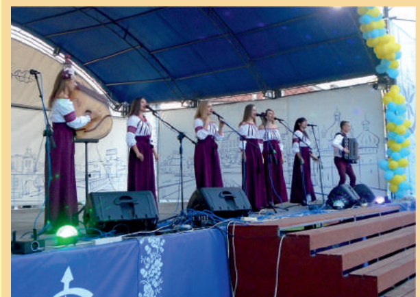
Урочистості до Дня Незалежності України