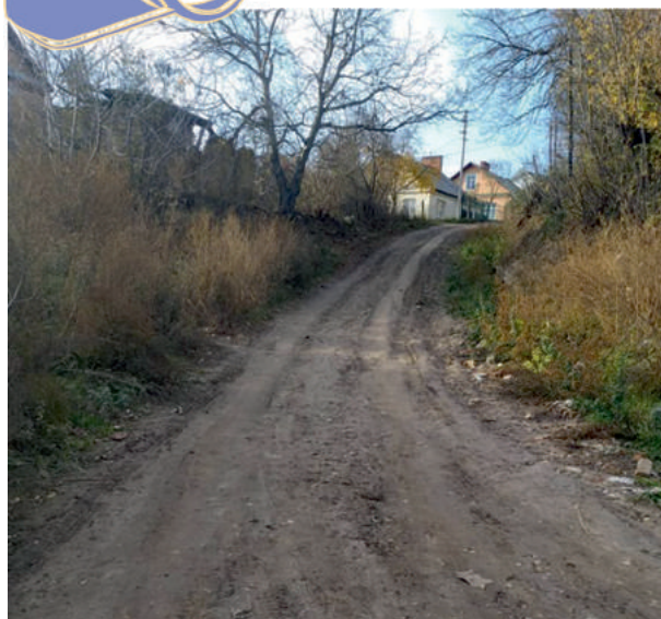
Вулиця Квітнева до ремонту