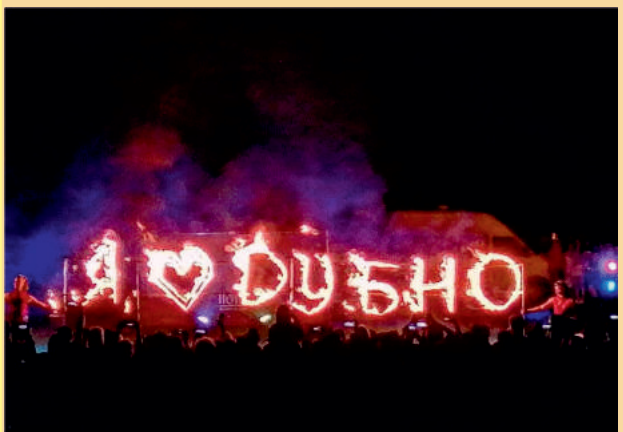
Файер-шоу у День молоді в Дубні