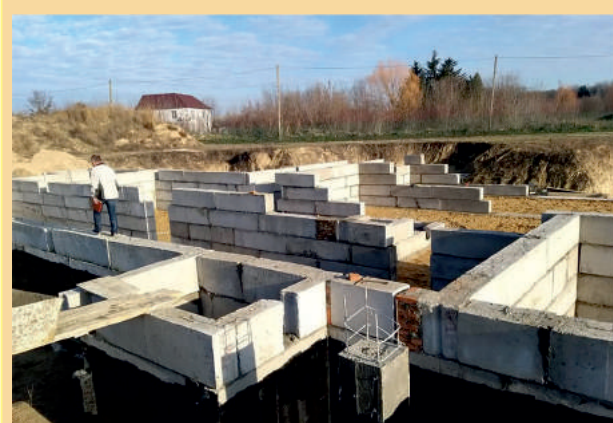
Продовжується будівництво дитячого садка