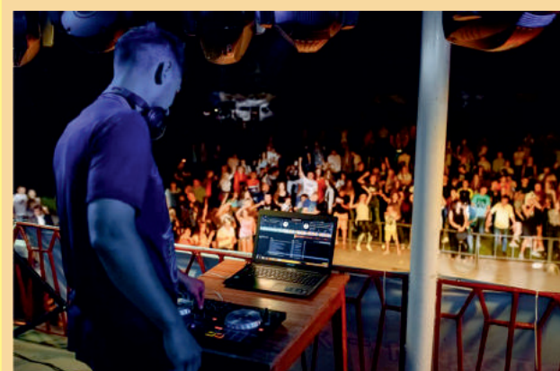
Перший фестиваль електронної музики DJ FEST