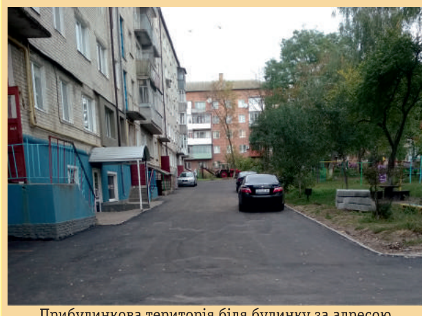
Прибудинкова територія біля будинку за адресою вул. Грушевського, 162