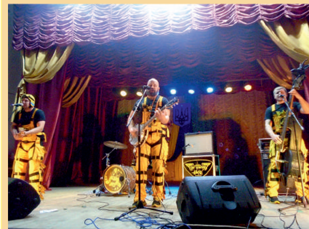
Відзначення Дня волонтера та свята Збройних Сил України. Гурт «Отвінта»