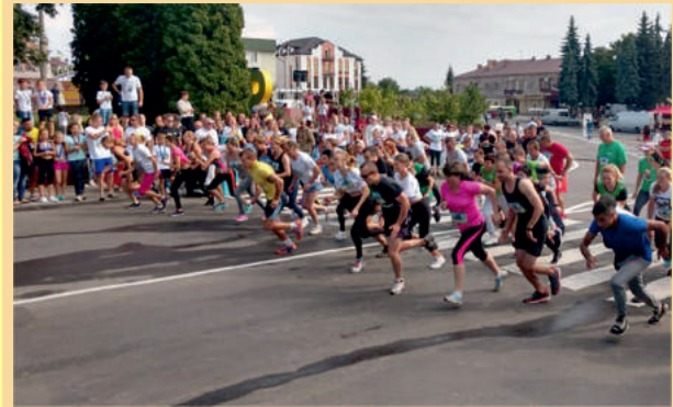
День міста. Благодійний марафон