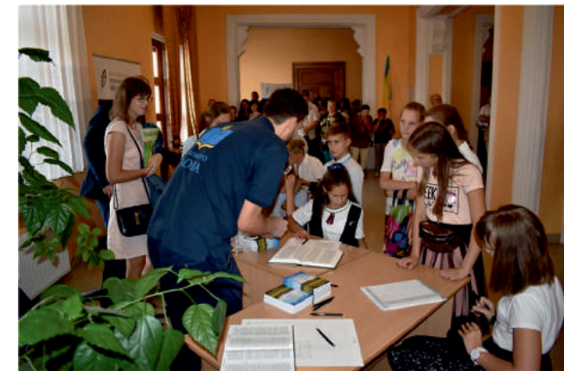
Учасники проекту «Рукописна Біблія»

Щорічно з нагоди Дня фізичної культури та спорту міська влада нагороджує кращих спортсменів, тренерів, викладачів та вчителів фізичної культури, ветеранів та шанувальників спорту. 11 провідних спортсменів міста отримують стипендію Дубенської міської ради.