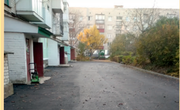
Прибудинкова територія біля будинку за адресою вул. Морозенка, 79