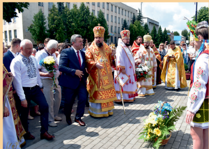
На День міста Дубно відвідав предстоятель ПЦУ Блаженніший владика Епіфаній