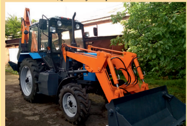
Для комунальних служб міста придбано екскаватор