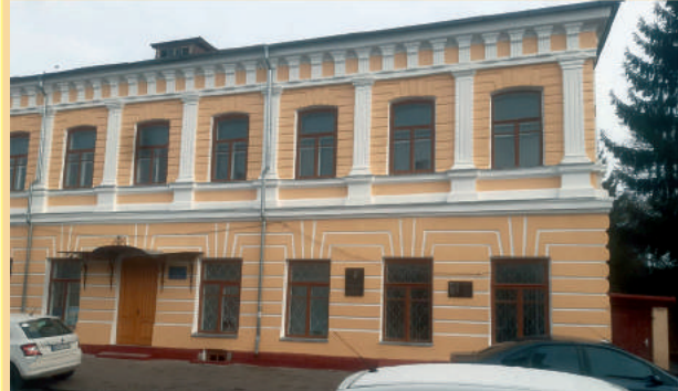
Відремонтовано фасад Будинку дітей та молоді