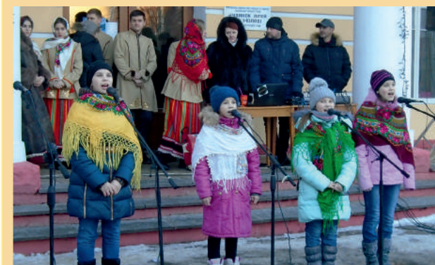
Свято колядок на Майдані Незалежності