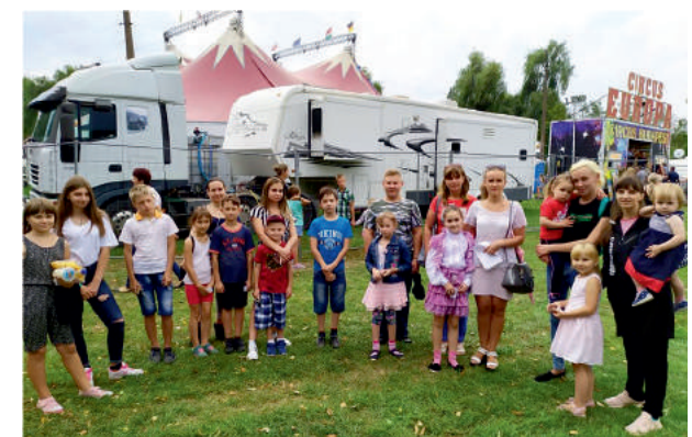
Відвідини циркової вистави дітьми соціальних категорій