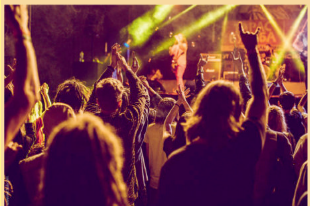
Найстаріший в Україні рок-фестиваль «Тарас бульба»