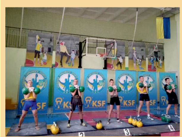
Відкритий Чемпіонат асоціації гирьового спорту України

конкурсах та розвагах із казковими героями, грали у різноманітні ігри, танцювали, веселилися.