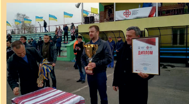
У Дубні відбувся Суперкубок Рівненщини з футболу