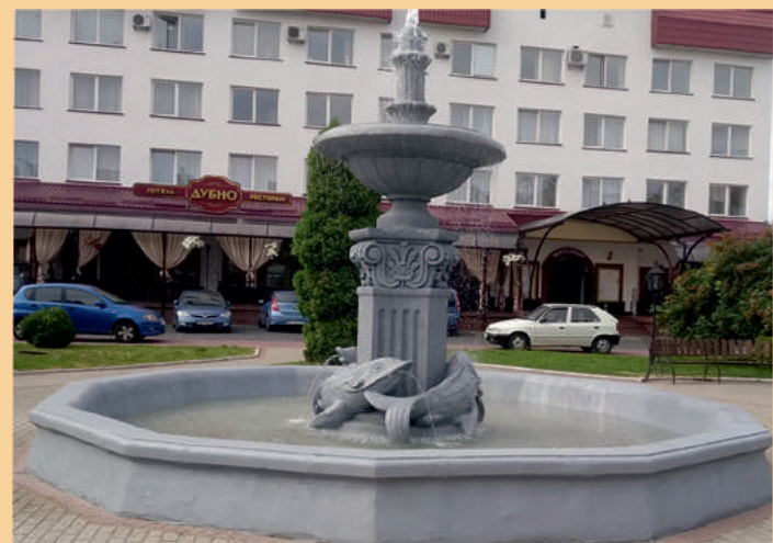
Відновлено роботу фонтану у скверіку на вулиці Данила Галицького

Роботи з капітального ремонту та реконструкції закладів охорони здоров'я та освіти проводилися за