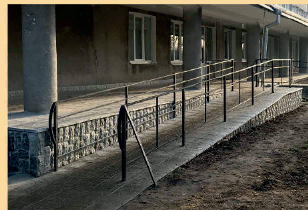
Облаштовано пандус до приміщення Міської поліклініки