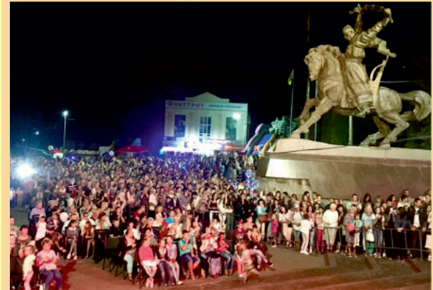
Урочистості до Дня міста на Майдані Незалежності