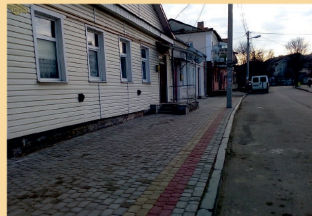
Облаштовано тротуар на вулиці Драгоманова