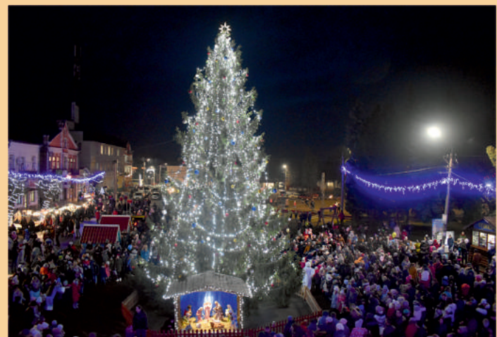
До Дня святого Миколая відбулося відкриття головної ялинки міста