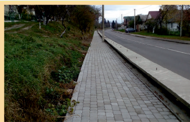
Вулиця Забрама з новим тротуаром

Для озеленення міських територій висаджено декоративні кущі та дерева, створено нові квітники на вулицях Грушевського, Сурмичі, Данила Галицького, на алеї до пам'ятного знаку Небесної сотні. Для збереження та розвитку тепличного господарства проведено роботи з капітального ремонту теплиць на суму 131 тисячу гривень.