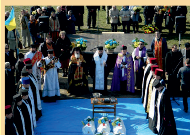
Перепоховання останків жертв розстрілів у дубенській в'язниці