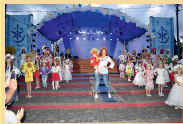
День міста. Показ-дефіле «Мій квітковий оберіг»