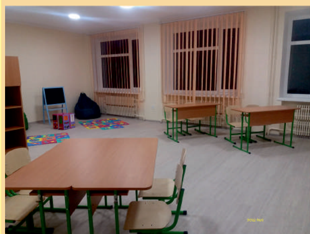
Інклюзивний клас у 30Ш № 6