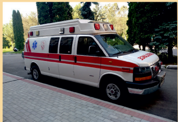
Автомобіль для транспортування вагітних та породіль, подарований Пологовому будинку дубенчанами, які проживають у США