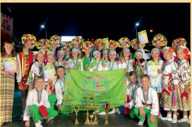
Дитячий танцювальний колектив «Надія» - переможець багатьох фестивалів та конкурсів