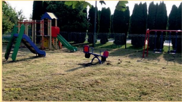
Встановлено дитячий ігровий майданчик в НВК ЗНЗ-ДНЗ