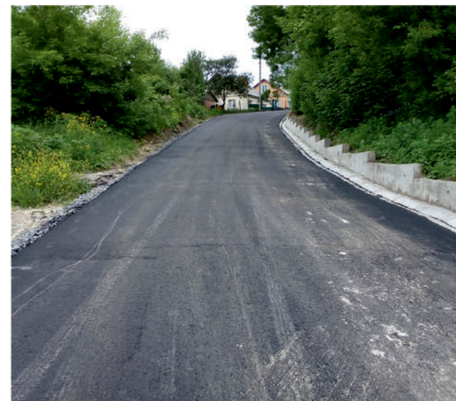
Вулиця Квітнева після ремонту