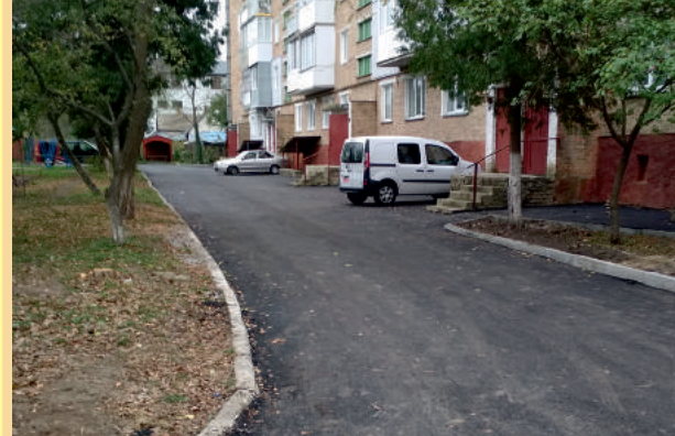
Прибудинкова територія біля будинку за адресою вул. Мирогощанська, 5