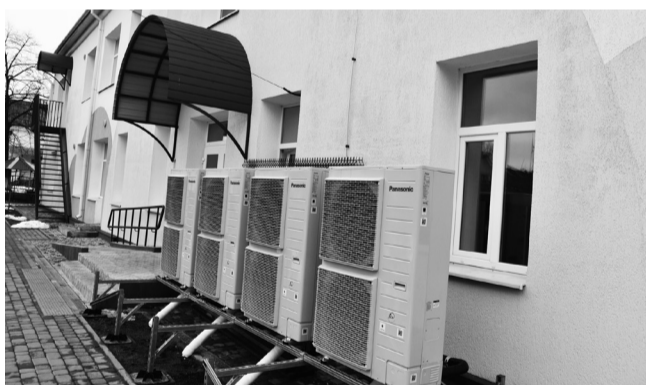
В ЗДО №4 встановлено теплові насоси

ція права власності на них, передача майна у межах комунальної власності громади, прийняття об'єктів у комунальну власність громади з інших форм власності.