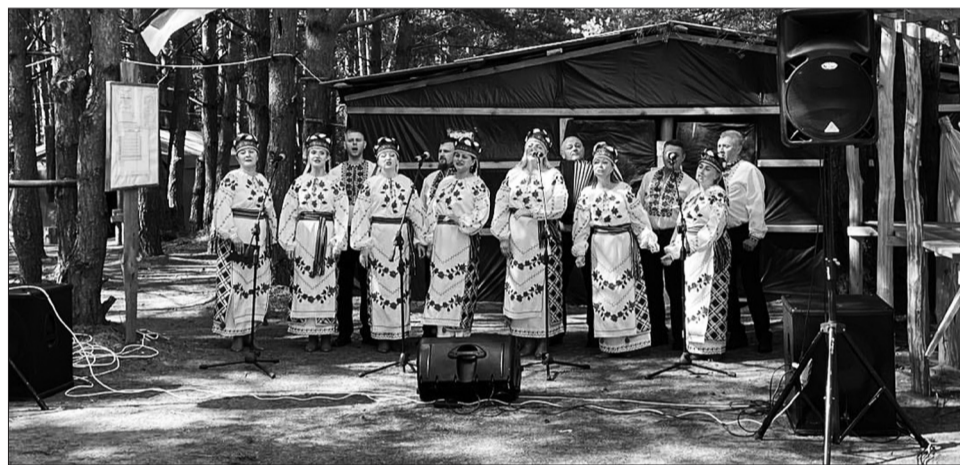
Творчі колективи Дубна підтримують наших захисників