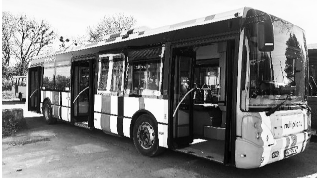
Всі міські автобуси обладнані GPS-трекерами

Проводиться робота з виготовлення технічної документації на об'єкти комунального майна громади, оформлення та реєстра-