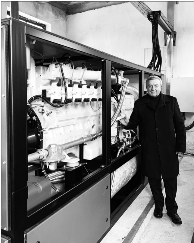
Встановлено когенераційні установки у 4 котельнях міста

Також виконано роботи з ліквідації аварійної ямковості струменевим методом автомобілем «Савалко» на вулицях