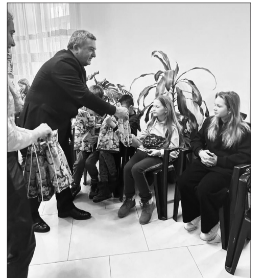
Підтримка дітей з родин ВПО

Слід зазначити, що службою у справах дітей постійно здійснюється контроль за додержанням вимог законодавства щодо захисту житлових, майнових та інших прав дітей мешканців міста Дубно. Служба також веде облік статусних дітей, які тимчасово переміщені на територію м. Дубно під час воєнного стану. Також службою активізована робота стосовно організації та проведення заходів, спрямованих на своєчасне виявлення дітей, які перебувають у складних життєвих обставинах.