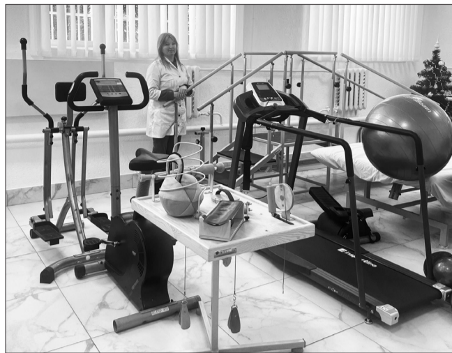
Реабілітаційний кабінет у Центрі ПМСД «Здоров'я+»

За рахунок коштів НСЗУ, благодійних внесків та централизованого постачання у 2024 році закладом було придбано та отримано: напівавтоматичний біохімічний аналізатор, системи зберігання енергії Tesla Powerwall, цистоскоп LAPOMED, електроагулятор височастотний зварювальний, комп'ютерна техніка, аналізатор швидкості осідання еритроцитів, електрокардіографи, електромеханічні операційні столи OM-6N, портативний венозний сканер з мобільною підставкою, автоматизована миюча машина для ендоскопів з функцією дезінфекції Endo Clean1000, хірургічний стельовий LED світильник двокупольний Medik, апарат наркозно-дихальний, реабілітаційна бігова доріжка 7.0T, біохімічний багатоканальний аналізатор, конвек-