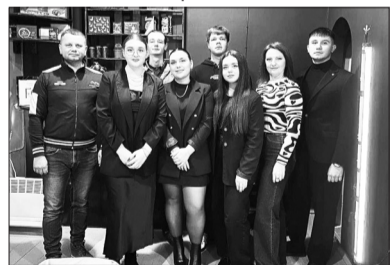
Відкрито молодіжний простір «БАЗА»

Відкрито молодіжний простір «БАЗА», який став важливим осередком для активної молоді нашого міста. Тут молодь має змогу зустрічатися, реалізовувати творчі проекти, брати участь у тренінгах, лекціях, майстер-класах, кінопоказах, медитаціях, літературних вечорах, настільних іграх, дискусіях, календарних свят та пам'ятних дат та інших заходах, спрямованих на їхній розвиток.