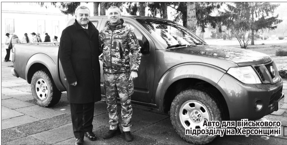
Авто для військового підрозділу на Херсонщині