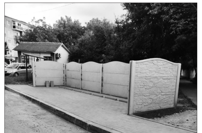
Облаштовано контейнерний майданчик на вулиці Семидубській

Станом на 1 січня 2025 року діють 36 договорів на право тимчасового користування місцями розташування рекламних засобів на загальну суму 498 тисяч гривень. До місцевого бюджету рекламорозповсюдженцями сплачено 509 тисяч 380 гривень.