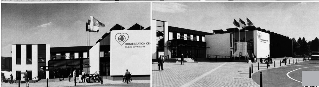
Проект Центру реабілітації міської лікарні