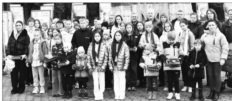
Церемонія вручення пам'ятної відзнаки «Батьківське серце»

Також слід відзначити, що 18 провідних спортсменів міста у 2024 році отримали одноразові стипендії Дубенської міської ради.