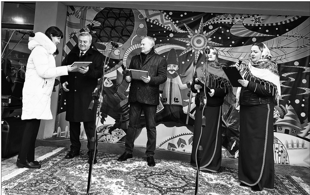
Різдвяний захід «Колядує вся родина, моя рідна Україна»

Для задоволення культурних потреб громади в місті функціонують: міський Будинок культури, КЗ «Дубенський міський будинок культури», міський клуб, Школа мистецтв Дубенської міської ради та п'ять бібліотек. Працівники базової мережі закладів культури, творчі колективи є організаторами та постійними учасниками свят, концертів і фестивалів, семінарів та виставок.