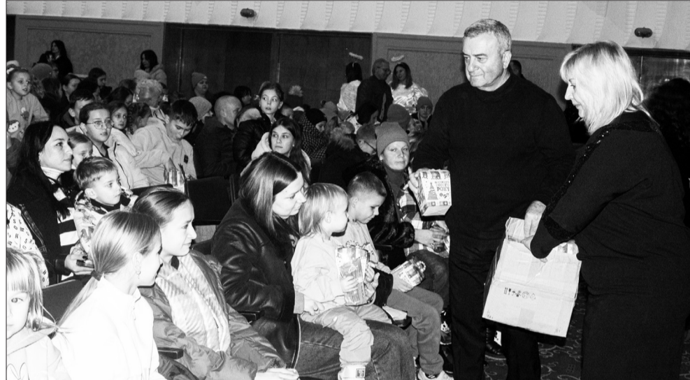
Святкова програма для дітей соціальних категорій до Дня Святого Миколая

видів послуг немобільним підопічним з IV-V рухомою активністю. Цією командою обслужено 106 осіб, яким надано 495 послуг.