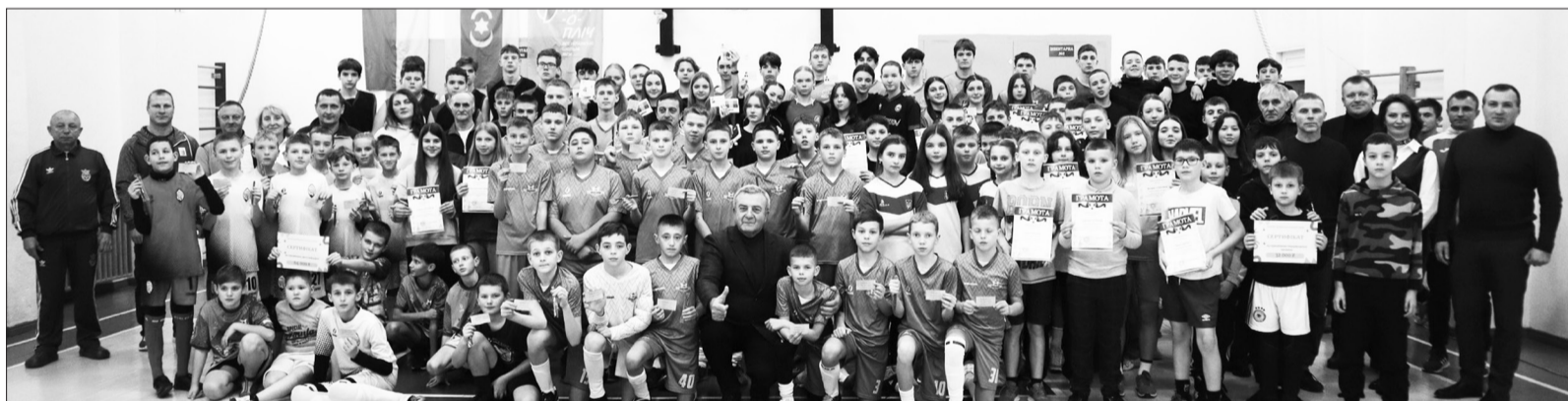
Урочисте підведення підсумків спортивного року у ДЮСШ

Вперше у Дубенській міській громаді проведено урочисту церемонію вручення пам'ятної відзнаки «Батьківське серце» дітям, батьки яких загинули під час бойових дій на сході України, захищаючи її незалежність, суверенітет і територіальну ціліс-