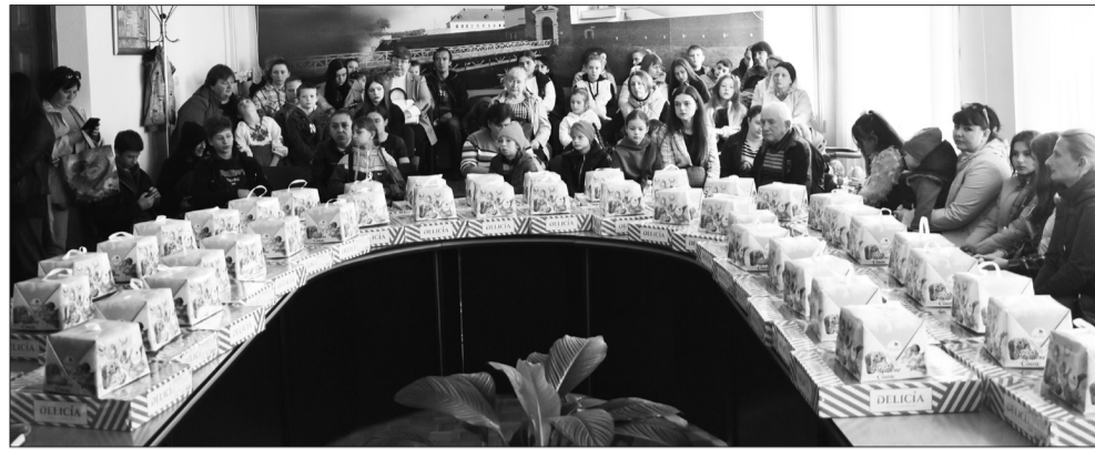
Благодійна акція «Великодні кошик»

У територіальному центрі функціонує мультидисциплінарна команда для надання різних