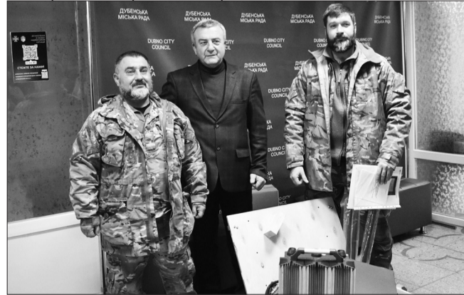
Черговий РЕБ для 208 батальйону на Куп'янський напрям

Протягом 2024 року працівники Дубенської міської ради, її відділів та управлінь, комунальних підприємств постійно долучалися до підтримки Збройних Сил України. Наприкінці року працівниками Дубенської міської ради, її відділів та управлінь, комунальних підприємств «Зелене господарство», «Дубноводоканал», «Дубнокомуненергія», «Архітектор», «Дубномістобуд», закладів охорони здоров'я м.Дубна, закладів культури та соціального захисту населення, всіх ліцеїв міста, закладів дошкільної та позашкільної освіти було зібрано 719 тисяч 575 гривень на підтримку ЗСУ. За ці кошти придбали два автомобілі Nissan Navara. Одна з цих автівок вирушила з нашим воїном-земляком в бойовий підрозділ на Херсонщині. Іншу передано одній з місцевих військових частин, яка здійснює важливий внесок у захист повітряного простору Дубенської громади від російської агресії.