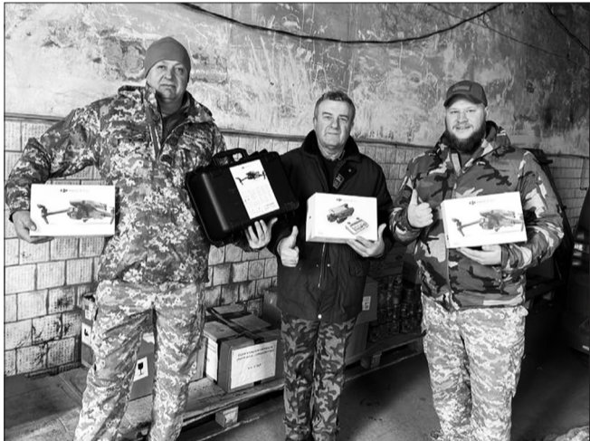
Велику партію дронів передано військовим в зону бойових дій

Впродовж 2024 року надано фінансову підтримку військовим частинам Дубенського гарнізону та іншим підрозділам Збройних Сил України у сумі 720 тисяч гривень.