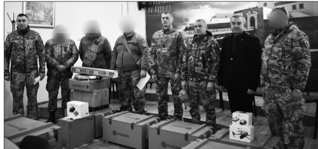
РЕБ та дрони ЗСУ від Дубенської громади

На початку грудня передав від нашої громади чергову партію допомоги для Збройних Сил України. Представникам військових частин за їхніми запитамі надано 8 РЕБів «PARASOL» 02 та 2 РЕБ ПСМК «Синиця 3.1», виносну антену, 2 квадрокоптери DJI Mavic 3T та квадрокоптер Mavic 3PRO. Обладнання загальною вартістю понад 2 мільйони гривень придбане у рамках відповідної міської програми. Також військовим передано 3 дрони та кілька десятків турнікетів, наданих у якості допомоги литовським містом-побратимом Рокишкіс. За словами військових, отримання цих спецзасобів є надзвичайно важливим кроком у зміцненні обороноздатності.