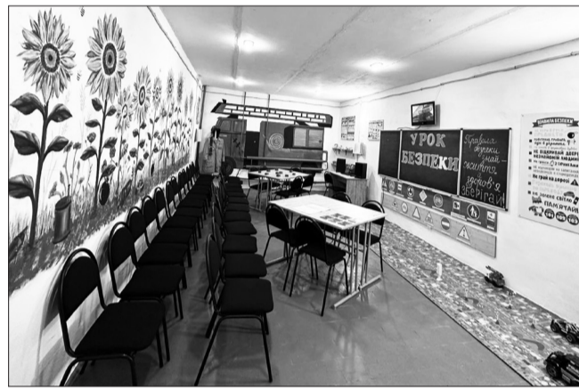
Клас безпеки ліцею №5

В планах на 2025 рік - створення безпечного освітнього середовища в Дубенській початковій школі - завершення капітального будівництва укріття (ПРУ) для всіх учасників освітнього процесу даного закладу, реконструкція харчоблоків закладів освіти, капітальний ремонт класів Осередку з викладання навчального предмету «Захист України» в Дубенському ліцеї №6 та капітальний ремонт (заміна покрівлі) в Інклюзивно-ресурсному центрі.