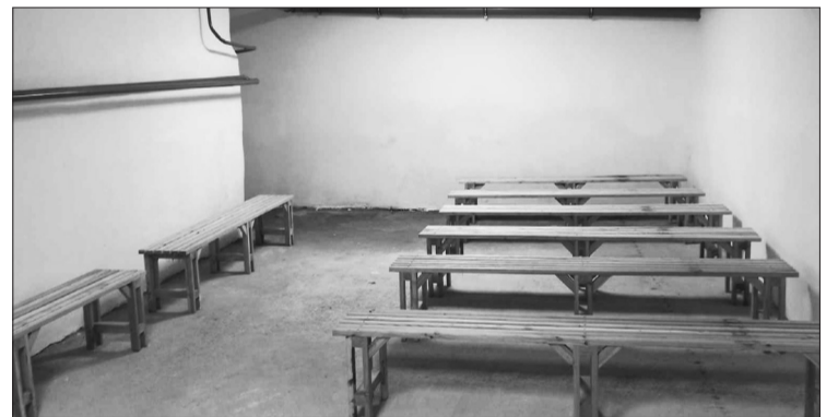
Відремонтване укриття в будинку по Мирогощанській

Пунктах незламності проведені акти перевірки, є паспорти ПН, розроблені інструкції відповідальних щодо забезпечення роботи, вказані графіки роботи, всі забезпечені інтернетом, обігрівачами, є вода, чай, кáva, продукти харчування, медична аптечка, за-