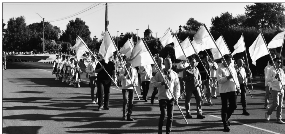
Урочисте відзначення Дня Державного Прапора України