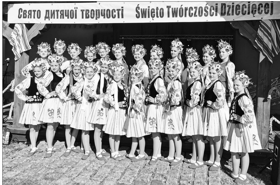
Танцювальний колектив «Надія» виступив на Святі дитячої творчості у Польщі

У 2024 році, згідно рішення Координаційної ради з питань книговидавничої справи, відділом культури і туризму надано фінансову підтримку кандидату історичних наук Юрію Пшеничному для видання наукової монографії під назвою «Дубно та його округ в Х-XVIII ст. Дослідження з історичної топографії мікрорегіону» у сумі 164 тисячі гривень. Книга містить 550 сторінок, 339 ілюстрацій, близько половини з яких кольорові. Тираж буде реалізовано некомерційним шляхом для науково-освітніх, науково-дослідницьких та пам'яткоохоронних цілей громади міста.