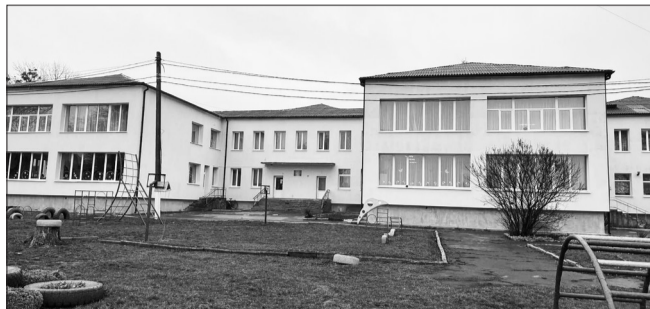
Ремонт фасаду ЗДО №6

Окрім косметичних та/або поточних ремонтів в загальних приміщеннях закладів освіти (оновлено коридори, класні кабінети та спортивні роздягалки, зали) при підготовці до нового 2024-2025 навчального року, проведено капітальні та поточні ремон-