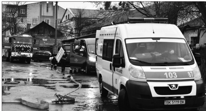
Комплексна перевірка системи цивільного захисту міста

Згідно останньої перевірки стану захисних споруд, проведеної в жовтні-листопаді 2024 року було проведено огляд на стан придатності всіх захисних споруд. Всього на обліку в місті Дубно перебуває придатних до використання 78 укриттів (55 ПРУ і 23 найпростіших укриттів). З бюджету міста у 2024 році виділено 6 мільйонів 559 тисяч гривень на виконання ремонтних робіт та введення в експлуатацію додаткової кількості захисних споруд цивільного захисту. Також у 2024 році проводилось будівництво протирадіаційного укриття на території Дубенської початкової школи. Загальна кошторисна вартість об'єкту будівництва становить 26 мільйонів 272 тисячі гривень, на яке з міського бюджету, в порядку співфінансування, виділено 5 мільйонів гривень (роботи продовжуються). У 2025 році будуть проведені ремонти у двох ПРУ (пологовий будинок та житловий багатоквартирний будинок). На початок поточного року беззахайних захисних споруд не