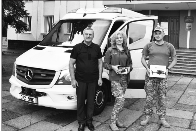
Автомобіль швидкої допомоги від партнерів з Чехії для воїнів-земляків на передову