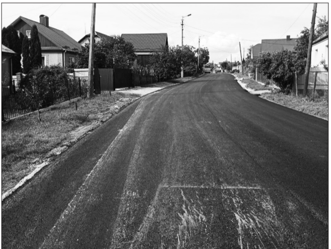
Здійснено капітальний ремонт вулиці Підборці

В умовах воєнного стану забезпечено фінансування мереж зовнішнього освітлення вулиць і загальноміських територій відповідно до встановлених графіків за виключенням періоду