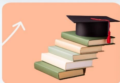
Професії та підвищення кваліфікації