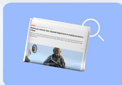
Новини та статті