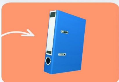
Документи, довідники, брошури