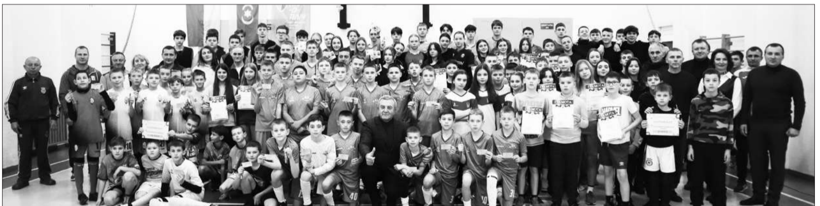
Урочисте підведення підсумків спортивного року у ДЮСШ

Вперше у Дубенській міській громаді проведено урочисту церемонію вручення пам'ятної відзнаки «Батьківське серце» дітям, батьки яких загинули під час бойових дій на сході України, захищаючи її незалежність, суверенітет і територіальну ціліс-