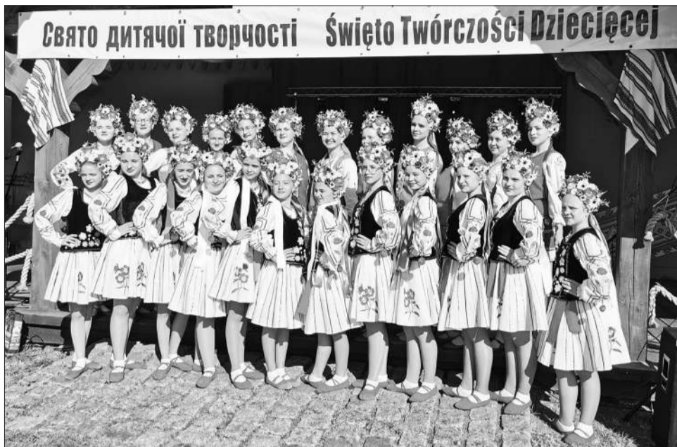
Танцювальний колектив «Надія» виступив на Святі дитячої творчості у Польщі

У 2024 році, згідно рішення Координаційної ради з питань книговидавничої справи, відділом культури і туризму надано фінансову підтримку кандидату історичних наук Юрію Пшеничному для видання наукової монографії під назвою «Дубно та його округ в Х-XVIII ст. Дослідження з історичної топографії мікрорегіону» у сумі 164 тисячі гривень. Книга містить 550 сторінок, 339 ілюстрацій, близько половини з яких кольорові. Тираж буде реалізовано некомерційним шляхом для науково-освітніх, науково-дослідницьких та пам'яткоохоронних цілей громади міста.