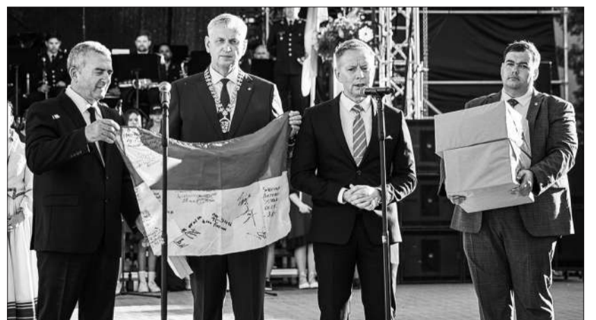
Візит у литовське місто-побратим Рокишкіс

На початку серпня до Дубна прибув дуже важливий і довгоочікуваний автомобіль швидкої допомоги з Чехії. Це вже друга «швидка» від дружнього Оломоуцького