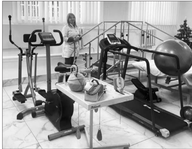
Реабілітаційний кабінет у Центрі ПМСД «Здоров'я+»

За рахунок коштів НСЗУ, благодійних внесків та централизованого постачання у 2024 році закладом було придбано та отримано: напівавтоматичний біохімічний аналізатор, системи зберігання енергії Tesla Powerwall, цистоскоп LAPOMED, електроагулятор височастотний зварювальний, комп'ютерна техніка, аналізатор швидкості осідання еритроцитів, електрокардіографи, електромеханічні операційні столи OM-6N, портативний венозний сканер з мобільною підставкою, автоматизована миюча машина для ендоскопів з функцією дезінфекції Endo Clean1000, хірургічний стельовий LED світильник двокупольний Medik, апарат наркозно-дихальний, реабілітаційна бігова доріжка 7.0T, біохімічний багатоканальний аналізатор, конвек-