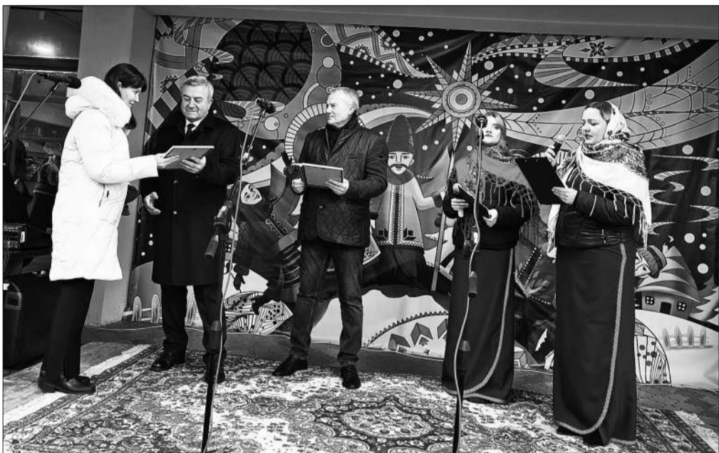
Різдвяний захід «Колядує вся родина, моя рідна Україна»

Для задоволення культурних потреб громади в місті функціонують: міський Будинок культури, КЗ «Дубенський міський будинок культури», міський клуб, Школа мистецтв Дубенської міської ради та п'ять бібліотек. Працівники базової мережі закладів культури, творчі колективи є організаторами та постійними учасниками свят, концертів і фестивалів, семінарів та виставок.