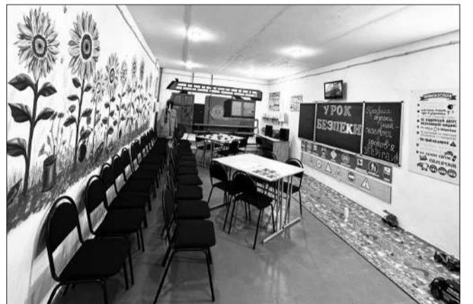
Клас безпеки ліцею №5

В планах на 2025 рік - створення безпечного освітнього середовища в Дубенській початковій школі - завершення капітального будівництва укріття (ПРУ) для всіх учасників освітнього процесу даного закладу, реконструкція харчоблоків закладів освіти, капітальний ремонт класів Осередку з викладання навчального предмету «Захист України» в Дубенському ліцеї №6 та капітальний ремонт (заміна покрівлі) в Інклюзивно-ресурсному центрі.