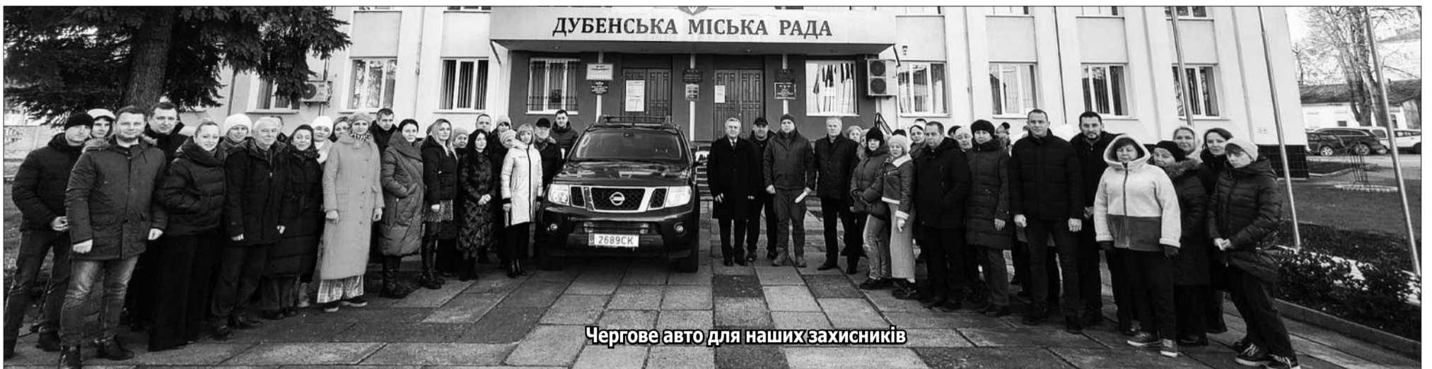
Чергове авто для наших захисників