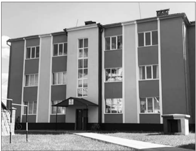
Оновлений фасад будівлі Дубенського ліцею №3

Дошкільною освітою охоплено 780 дітей, загальною середньою - 5015 та позашкільною - 1573.