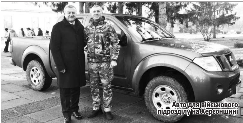
Авто для військового підрозділу на Херсонщині