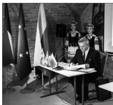
Підписання угоди про співробітництво з Тракайським районом Литовської Республіки

У минулому році ми отримали нового міжнародного партнера. В липні 2024 року в межах Форуму громад Волині на тему «Реформи. Децентралізація. Євроінтеграція», відбулося підписання Угоди про співробітництво між Дубенською міською радою (Україна) та Муніципалітетом Тракайського району (Литовська Республіка). Угодою передбачається формування партнерських відносин та поглиблення взаємодії, зокрема у сферах туризму і спорту; науки та освіти; культури і мистецтв; економічних відносин; розвитку ділової активності; спільного залучення міжнародної технічної допомоги; підготовки спільних проектів для участі в програмах та структурних фондах Європейського Союзу (зокрема таких, як Програма Interreg Europe). Працюватимемо над роз-