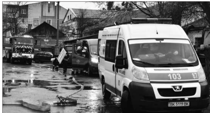
Комплексна перевірка системи цивільного захисту міста

Згідно останньої перевірки стану захисних споруд, проведеної в жовтні-листопаді 2024 року було проведено огляд на стан придатності всіх захисних споруд. Всього на обліку в місті Дубно перебуває придатних до використання 78 укриттів (55 ПРУ і 23 найпростіших укриттів). З бюджету міста у 2024 році виділено 6 мільйонів 559 тисяч гривень на виконання ремонтних робіт та введення в експлуатацію додаткової кількості захисних споруд цивільного захисту. Також у 2024 році проводилось будівництво протирадіаційного укриття на території Дубенської початкової школи. Загальна кошторисна вартість об'єкту будівництва становить 26 мільйонів 272 тисячі гривень, на яке з міського бюджету, в порядку співфінансування, виділено 5 мільйонів гривень (роботи продовжуються). У 2025 році будуть проведені ремонти у двох ПРУ (пологовий будинок та житловий багатоквартирний будинок). На початок поточного року беззахайних захисних споруд не