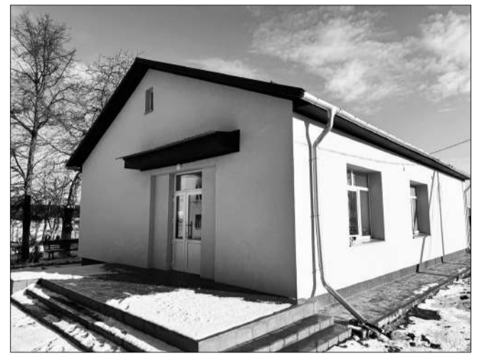
Капітально відремонтоване приміщення патологоанатомічного відділення

сний датчик, стельовий підйомник+стропи для системи стельового підйомника на загальну суму 8 мільйонів 314 тисяч гривень.