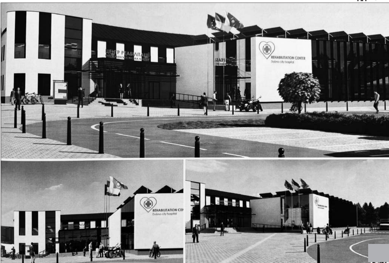
Проект Центру реабілітації міської лікарні

За кошти НСЗУ у сумі 1 мільйон 734 тисячі гривень та 612 тисяч гривень зі спец рахунку закуплено медикаменти та медичні вироби, продукти харчування, паливно-мастильні матеріали, миючі засоби, господарські та канцелярські товари.