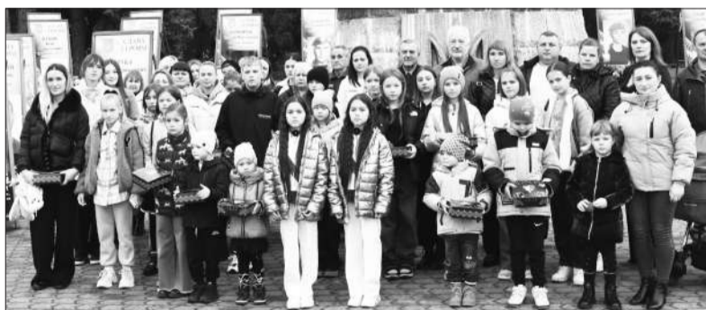
Церемонія вручення пам'ятної відзнаки «Батьківське серце»

Також слід відзначити, що 18 провідних спортсменів міста у 2024 році отримали одноразові стипендії Дубенської міської ради.