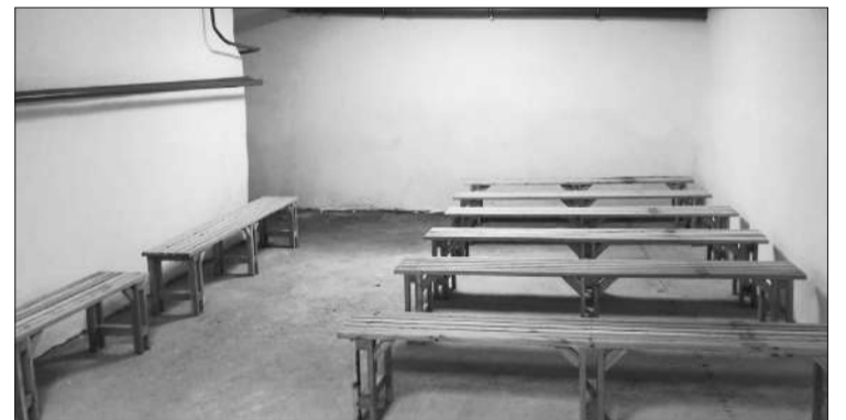
Відремонтоване укриття в будинку по Мирогощанській

Пунктах незламності проведені акти перевірки, є паспорти ПН, розроблені інструкції відповідальних щодо забезпечення роботи, вказані графіки роботи, всі забезпечені інтернетом, обігрівачами, є вода, чай, кави, продукти харчування, медична аптечка, за-