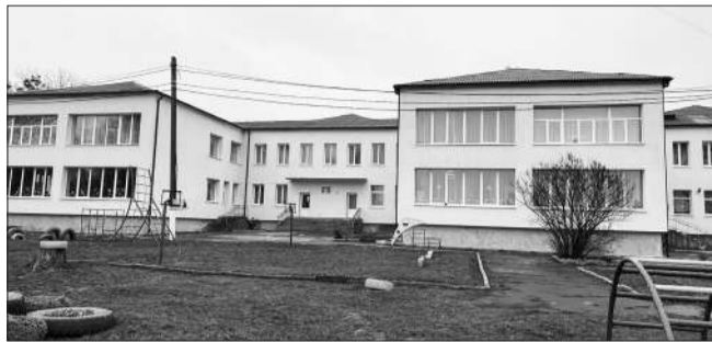
Ремонт фасаду ЗДО №6

Окрім косметичних та/або поточних ремонтів в загальних приміщеннях закладів освіти (оновлено коридори, класні кабінети та спортивні роздягалки, зали) при підготовці до нового 2024-2025 навчального року, проведено капітальні та поточні ремон-