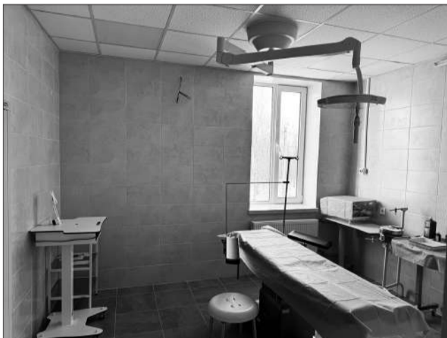
Нова перев'язувальна травматологічного відділення