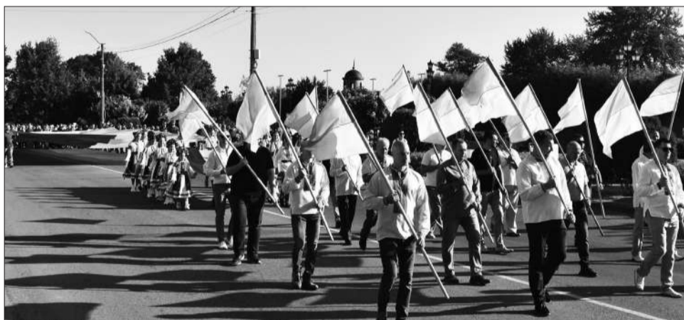
Урочисте відзначення Дня Державного Прапора України