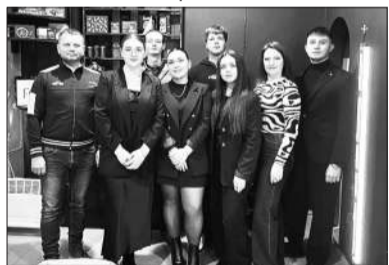
Відкрито молодіжний простір «БАЗА»

Відкрито молодіжний простір «БАЗА», який став важливим осередком для активної молоді нашого міста. Тут молодь має змогу зустрічатися, реалізовувати творчі проекти, брати участь у тренінгах, лекціях, майстер-класах, кінопоказах, медитаціях, літературних вечорах, настільних іграх, дискусіях, календарних свят та пам'ятних дат та інших заходах, спрямованих на їхній розвиток.