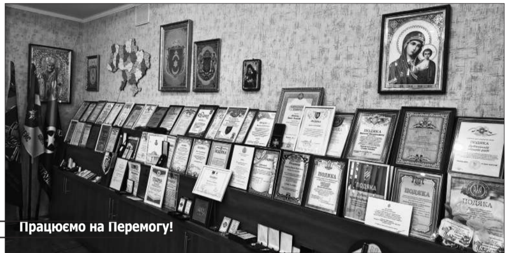
Працюємо на Перемогу!