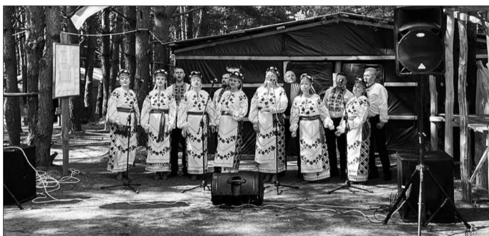
Творчі колективи Дубна підтримують наших захисників